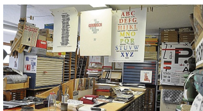
Eine Werkstatt, in der es nicht um Effizienz geht, sondern um Ästhetik. Auf den Plakaten, die hier hängen oder herumliegen, stehen Sätze wie: „Wir arbeiten analogisch und mit kreativer Intelligenz (KI)“.